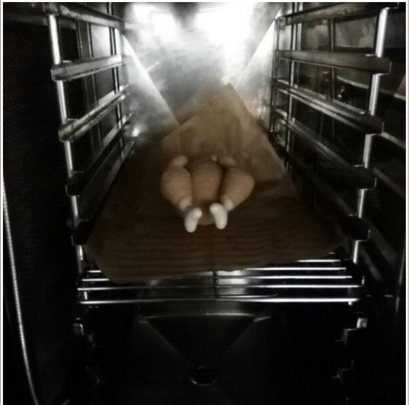
Abbildung 1: Brutzel in freier Wildbahn