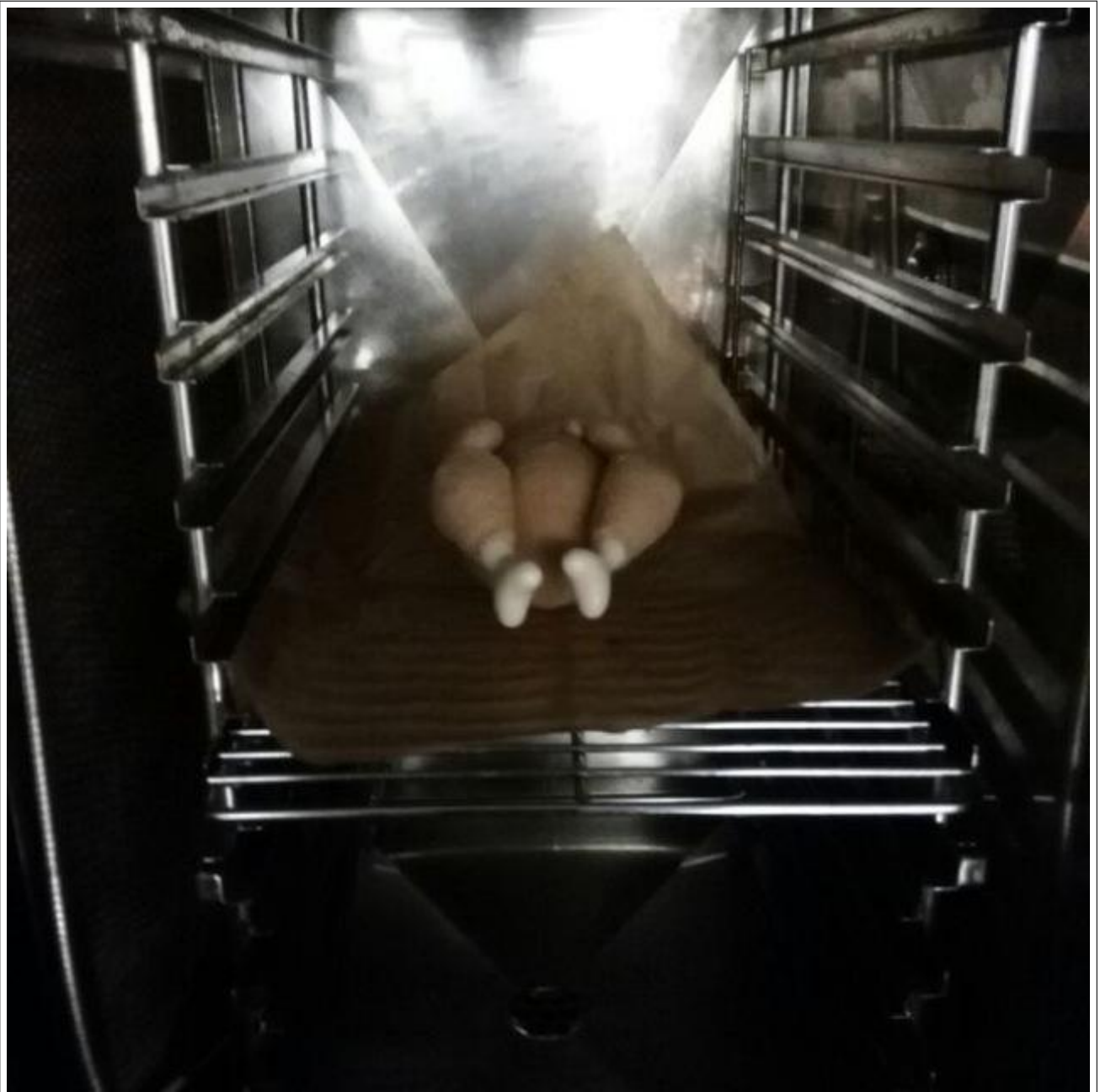
Abbildung 1: Brutzel in freier Wildbahn